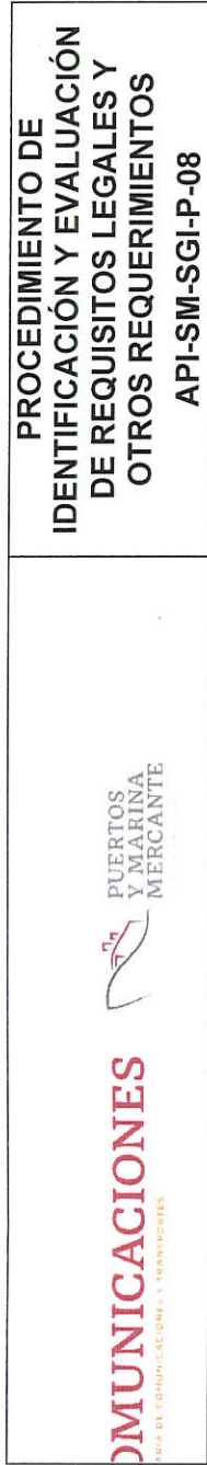
Anexo I.- “Identificación y Evaluación de cumplimiento de Requisitos Legales y otros Requisitos aplicables”